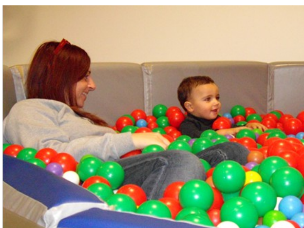
Giochi di espressività corporea