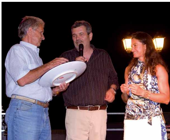
I nostri campioni

• avvio Lavori di Restauro della millenaria Pieve di San Donato in Polenta Ricordiamo infine alcuni interventi distribuiti su tutto il territorio comunale quali la manutenzione straordinaria di diversi alloggi di Edilizia Residenziale Pubblica o Case Popolari, il posizionamento di 13 pensiline alle fermate ATR, l'installazione di bacheche informative comunali (Bracciano, Borghetto FerroVia, Fratta Terme, Santa Maria Nuova). Una particolare cura è stata posta nella messa a norma delle attrezzature e dei giochi presenti nei giardini pubblici (Borghetto Ferrovia, Santa Maria Nuova, San Pietro in Guardiano).