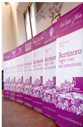
Le otto vele dei componenti il nuovo consorzio VINI di BERTINORO

Ma la pianificazione si è intensificata soprattutto in azioni che di solito "non si vedono": l'apertura annuale dell'Ufficio Informazioni (che è passato da 638 utenti censiti nel 2006, anno di inizio del nostro mandato, ai 2774 utenti censiti fino al 30 novembre 2010); una intensa attività di promozione del territorio in Italia e all'estero, in particolare attraverso fiere e contatti con giornalisti, svolta insieme ai nostri partner privati dell'Unione Città delle Terme e del Benessere e alla collaborazione cercata e coltivata con la Provincia di Forlì-Cesena e gli altri comuni del comprensorio forlivese